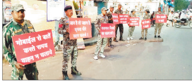
शहर में तखती लेकर लोगों को जागरूक करते जवान।