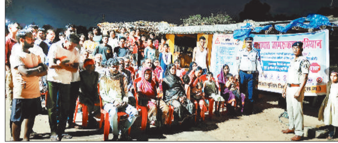
रात्रि में गांव में यातायात नियमों की जानकारी देते कर्मी।

और केनापारा में आयोजित जागरूकता कार्यक्रमों में ग्रामीणों को बताया गया कि