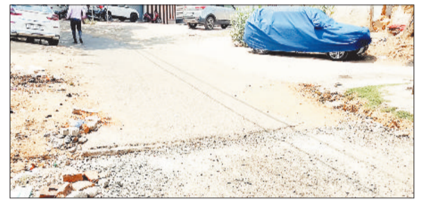
सड़क में की गई कटिंग।

चरचा कॉलरी। कोयलाखल क्षेत्र के चरचा कॉलरी को मौसम ने अचानक करवट ली। तेज बारिश और हल्की ओलावृष्टि जैसी स्थिति ने अप्रैल माह की चुस्तगी गर्मी से जूझ रहे लोगों को बड़ी राहत दी। तापमान में गिरावट आने से क्षेत्र में ठंडक घुल गई और लोगों ने इस अप्रत्याशित बदलाव का स्वागत किया। स्थानीय नागरिकों का कहना है कि अप्रैल में जहां तेज धूप और भीषण गर्मी से हालत बेहाल थी, वहीं मंगलवार को हुई बारिश और ओस जैसी गिरावट ने मौसम को सुखाना बना दिया। कुछ स्थानों पर बर्फ जैसी बूंदें गिरने की भी जानकारी मिली है, जिससे लोगों ने इसे हल्की ओलावृष्टि का नाम दिया। चरचा क्षेत्र के किसानों ने इस परिवर्तन को फसलों के लिए लाभदायक बताया है। उनका कहना है कि इससे खेतों में जमी बनी रहेगी, जिससे आगामी बोआई कार्यों में मदद मिलेगी। हालांकि उन्होंने यह भी कहा कि अगर बारिश ज्यादा दिनों तक जारी रही, तो नुकसान की आशंका से इनकार नहीं किया जा सकता।